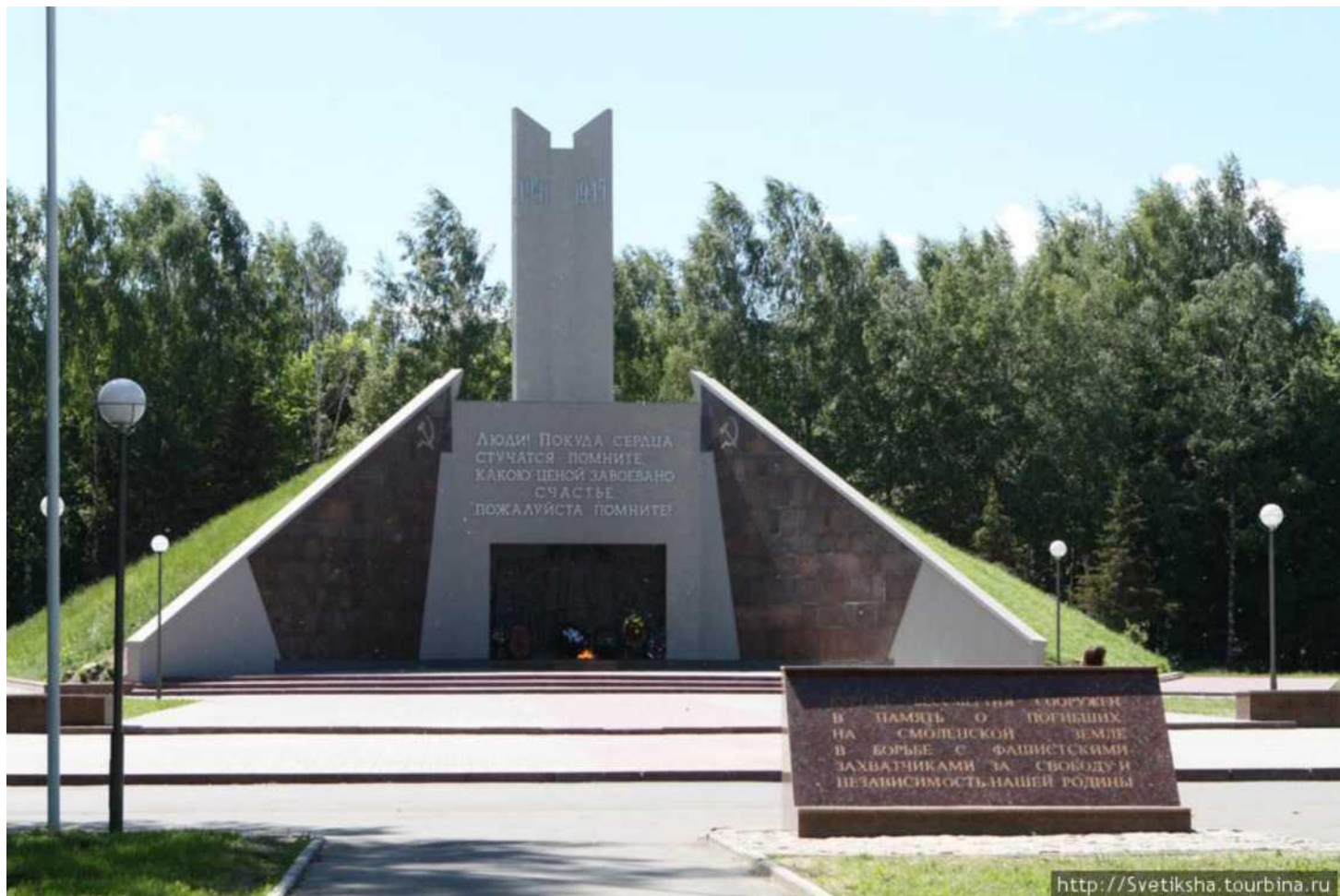
Курган бессмертия в Смоленске